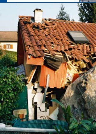
« Chute de blocs depuis le versant Est du massif de la Chartreuse Lumbin - janvier 2002 »

En France, deux communes sur trois sont réglementées au titre de leur exposition à un ou plusieurs phénomènes naturels et une sur trois est à proximité d'un site industriel