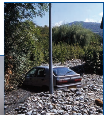
« Crue torrentielle Domène - Août 2005 »

Au regard du Code général des collectivités territoriales , du Code de l'urbanisme et du Code de l'environnement , le maire est tenu légalement d'adopter des politiques destinées à réduire les risques, se traduisant par des actions de prévention, de précaution et de protection des personnes et des biens.