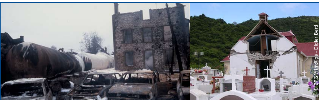
« Accident de train d'hydrocarbure en plein village Chavanay - Décembre 1990 »

Au regard du Code général des collectivités territoriales , du Code de l'urbanisme et du Code de l'environnement , le maire est tenu légalement d'adopter des politiques destinées à réduire les risques, se traduisant par des actions de prévention, de précaution et de protection des personnes et des biens.