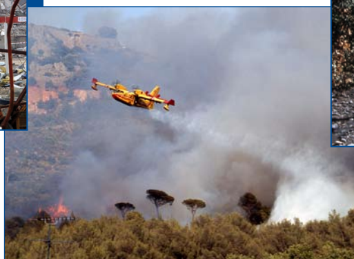
« Feu de broussailles et de résineux Evenos - Juillet 2004 »