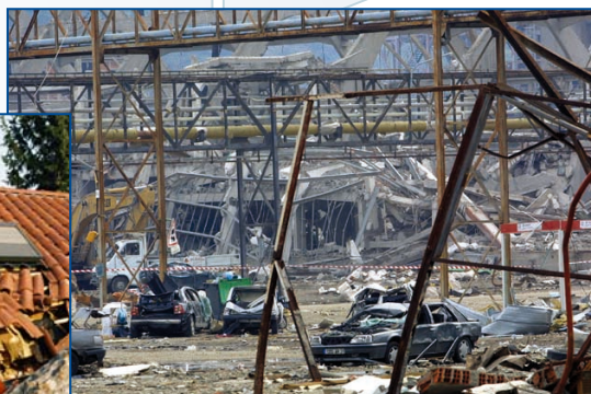
« Explosion de l'usine d'AZF Toulouse - Septembre 2001 »