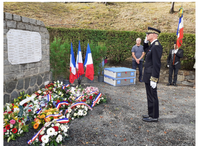
81e commémoration de la disparition de Marx Dormoy à Montuçon le 26 juillet