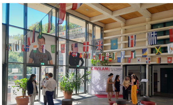
Echanges au CAVILAM de Vichy