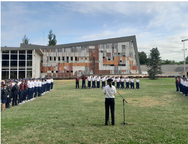
Cérémonie de célébration annuelle de la police nationale à Moulins le 7 juillet