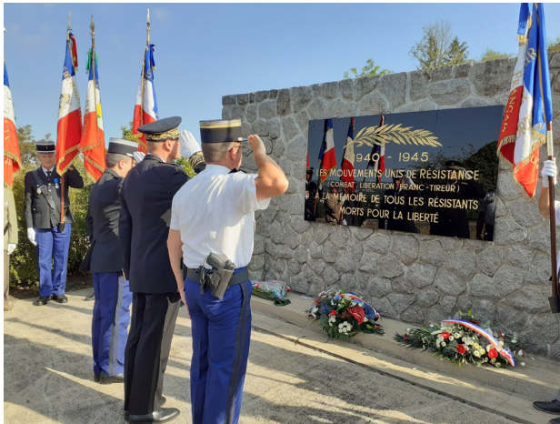
Commémoration de la libération de Vichy en 1944 le 26 août