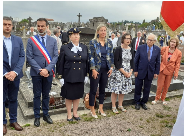
Cérémonie commémorative en mémoire des 3 Francs-tireurs et partisans français assassinés par les allemands le 30 août 1944 à Cesset