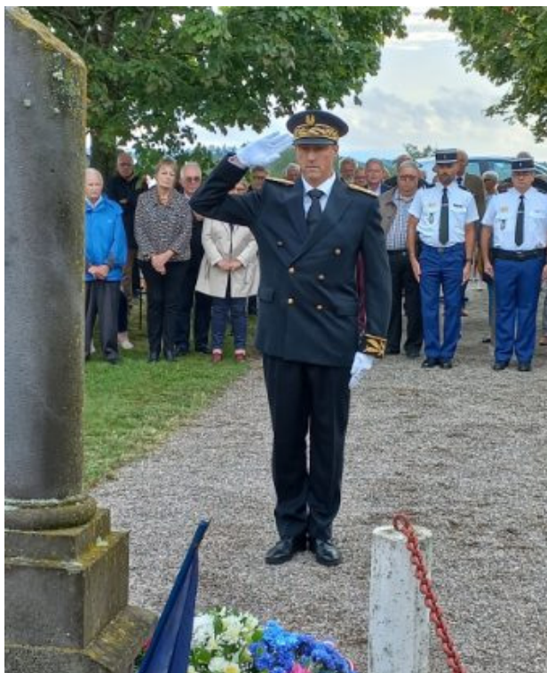
Commémoration de la rafle du 26 août 1942 à Vichy