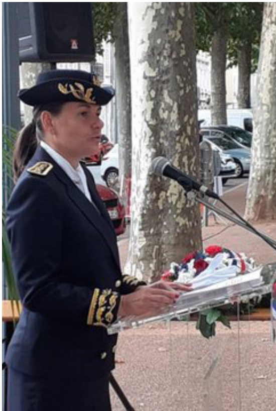
Cérémonie de commémoration du crash du bombardier au Brethon le 2 juillet