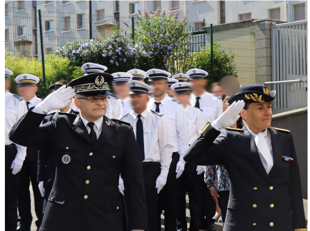
Hommage aux fusillés de la résistance à Prémilhat le 14 août