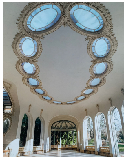
Pavillon de la source des Célestins