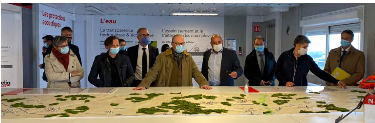
Visite du showroom à la base logistique d'ALIAE

À cette occasion, le préfet a inauguré la déviation de Villeneuve-sur-Allier, intégralement financée par l'État (32M€), et visité le chantier de l'A79. Des équipements qui permettent de désenclaver le territoire tout en veillant à la sécurité routière.