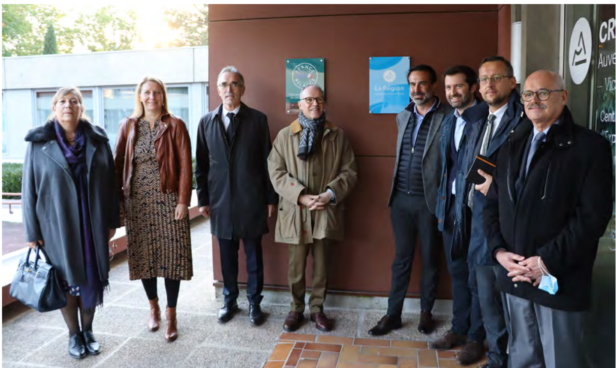
Visite du projet du CREPS Auvergne Rhône Alpes

Enfin, au CREPS de Vichy, le préfet a visité les installations et le chantier et a rappelé l'engagement de l'État dans le développement du sport, notamment par l'investissement dans les équipements sportifs. A l'approche de Paris 2024, l'État a engagé 23,5M€ pour rénover le site et y créer un Pôle performance.