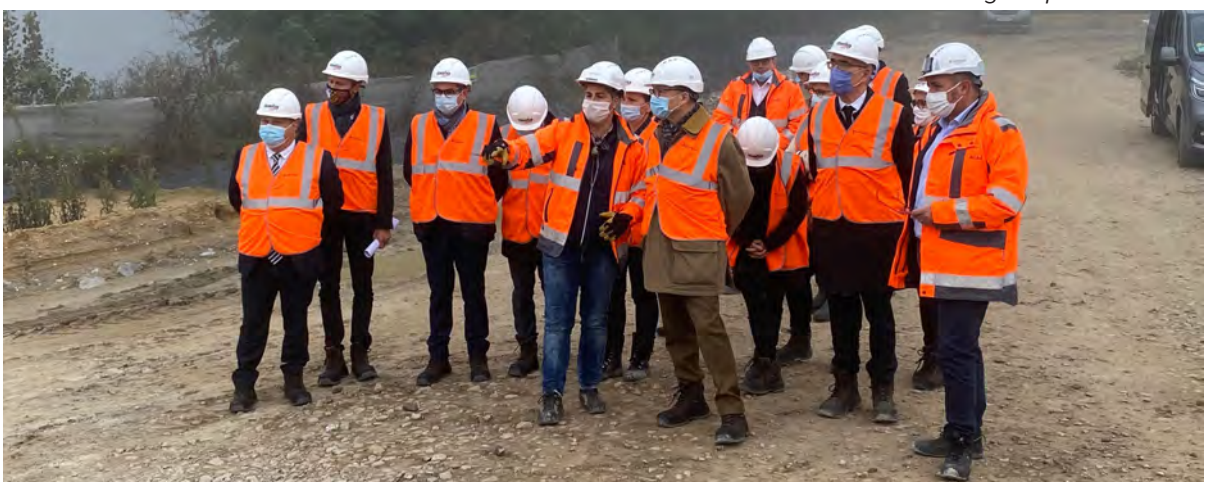
Visite du chantier A79