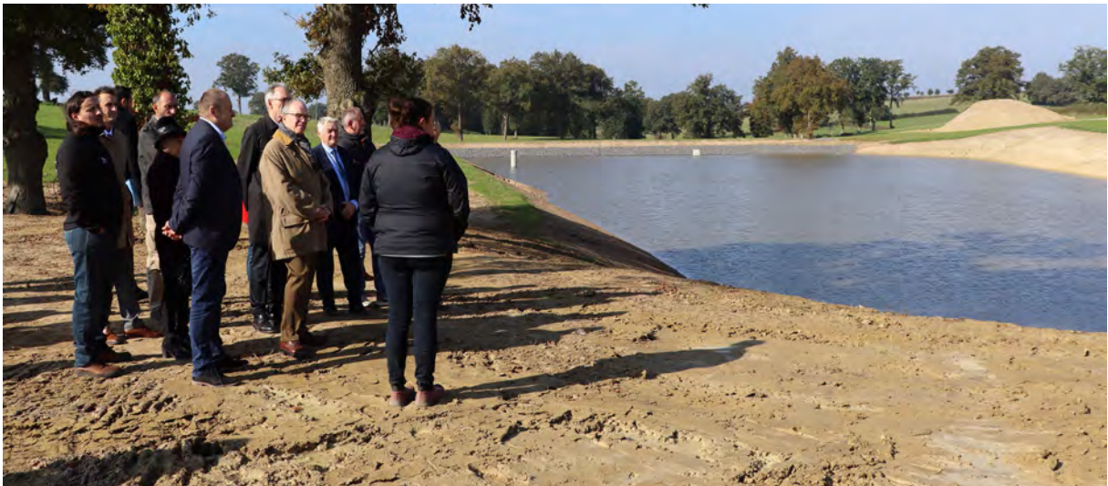
Retenue collinaire à Neuilly en Donjon

Il s'est ensuite rendu sur la commune de Neuilly-en-Donjon pour y rencontrer une jeune agricultrice qui a remis en eau un étang permettant l'irrigation des cultures afin d'améliorer l'autonomie fourragère de l'exploitation. Il a échangé avec les acteurs du monde agricole et les élus sur cette opération qui s'inscrit dans les réalisations de la stratégie Eau-Air-Sol, que l'État met en œuvre.