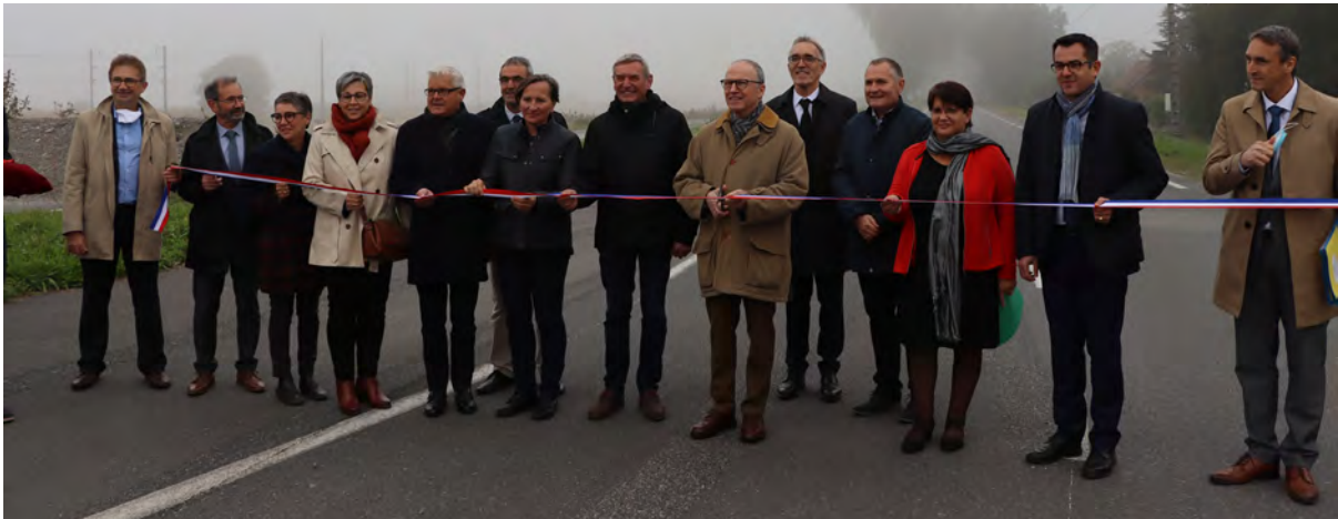
Inauguration de la nouvelle bretelle sur RN7